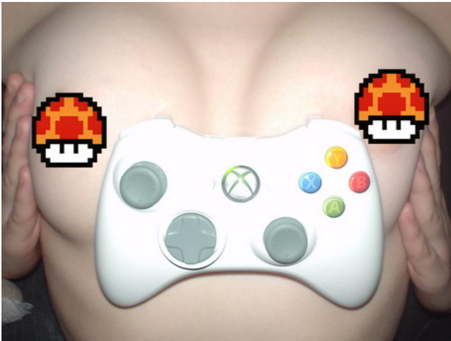
Najnowsza propozycja stojaka na pad od Xboxa 360

O tym, że płeć piękna również gra w najróżniejszej maści gry chyba nie muszą nikogo przekonywać. Odkąd na rynku pojawiła się pierwsza część popularnych Simsów w 1999 roku, emancypacja kobiet w świecie komputerowej rozrywki przybrała nieco na sile. Niektóre z nich są na tyle odważne by umieścić w internecie swoje (pół) nagie fotki , na których pozują obok swych ulubionych konsol i/lub gier. Postanowiliśmy je (prawie) wszystkie zebrać, ocenić i wybrać dziesięć najlepszych. Właśnie tę dziesiątkę będziecie mieli przyjemność oglądać po kliknięciu na "czytaj dalej". Zapraszam, bo naprawdę warto! Ale uwaga - od lat osiemnastu!