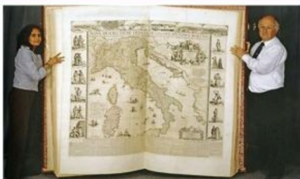
The Klencke Atlas has never been publicly displayed with its pages open before.

Oby przewrócić stronę w atlasie, trzeba to zrobić obiema rękami, żeby nie zniszczyć olbrzymich kart tego niezwykłego dzieła.