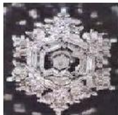
Woda z Tamy Fujiwara: przed ofiarą i po ofiarnej modlitwie.

Woda poddawana wpływowi „dobrych” słów zamrażała tworząc przepiękne struktury krystaliczne, natomiast woda, którą poddano działaniu „złych” słów zamrażała tworząc struktury pełne bałaganu i nieuporządkowania. Od razu zastrzeżenie: okazało się, że rodzaj języka (angielski, japoński, niemiecki itd.) nie odgrywał tu żadnej roli.