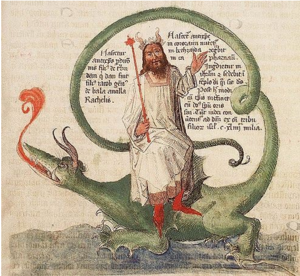
Antychryst siedzi na Bestii, średniowieczna ilustracja

Nastanie wtedy oczekiwane od tysięcy Królestwo Boże ze stojącym na czele Mesjaszem, potocznie nazywanym Wielkim Cybernetykiem, z tą różnicą, że bogiem będzie szatan!