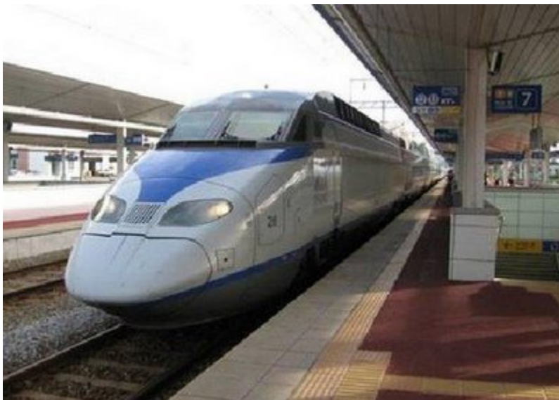
Korea: KTX - pociąg który kursuje na trasie Seul-Busan-Mokpo i osiąga maksymalną prędkość 350km/h.