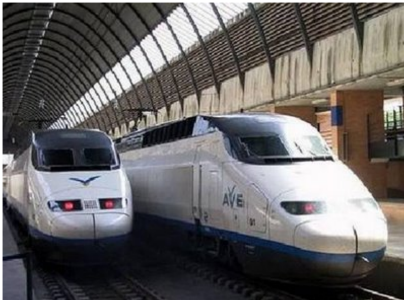
Hiszpania: AVE (Alta Velocidad Española) dosłownie Hiszpańska Wysoka Prędkość. Pociąg osiągnięty prędkość do 300km/h.