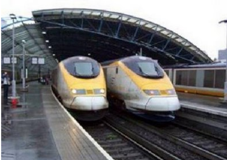
Anglia: Eurostar. Pociąg łączący Londyn - Kent w Anglii do Paryża i Lille we Francji i do Brukseli w Belgii. Prędkość maksymalna do 300km/h.