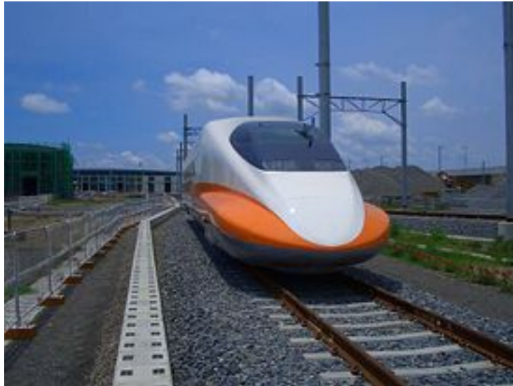
Tajwan: THSR 700T - pociąg który kursuje wzdłuż zachodniego wybrzeża Tajwanu i osiąga maksymalną prędkość 300km/h