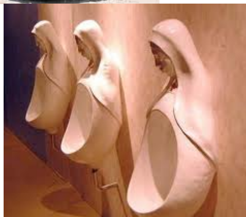
Prezentacja rekwizytów do filmu. Ten ostatni z wyraźnymi aluzjami do określonej partii politycznej.