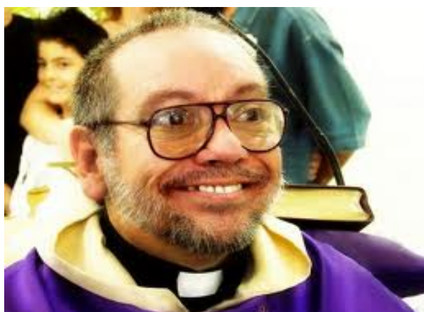
Bezkonkurencyjny zwycięzca castingu na rolę tytułową.