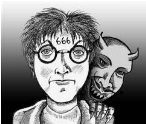
"6 x Nie"

U podstaw idei realizacji filmu leży 6 doktrynalnych pytań do wszystkich Katolików, na które MUSIMY sobie odpowiedzieć negatywnie: